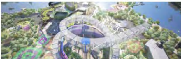
黄金海岸2018年联邦运动会基础设施