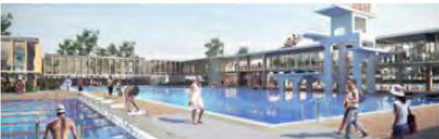
特别建造的潜水设施