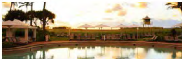
在标志性位置的大型娱乐活动基础设施